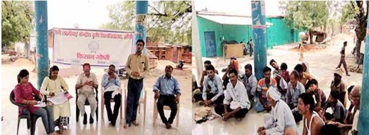
University faculty interacting with the farmers

University has adopted Kanchanpur village of Babina Block to promote best farming practices under the programme called Mera Gaon Mera Gaurav (MGMG). The scheme envisages scientists to select villages as per their convenience and remain in touch with the selected villages and provide information to the farmers on technical and other related aspects in a time frame through personal visits or on telephone to farmers for increasing farm productivity and production. Accordingly, a team of multidisciplinary scientists was also constituted for this purpose. Progressive