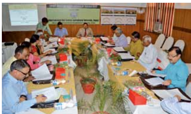
The third meeting of Board of Management in session

Functions of officers of the University.