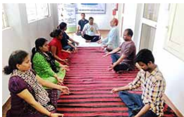
Yoga for Harmony and Peace

Yoga is a holistic science of life, which deals with physical, mental, emotional and spiritual health. It is based on an extremely subtle science which focuses on bringing harmony between mind and body. Yoga also enhances teamwork and communication. The International Day of Yoga is now celebrated world-over annually on 21 st June since its inception in 2015. The University decided to take forward the momentum created by