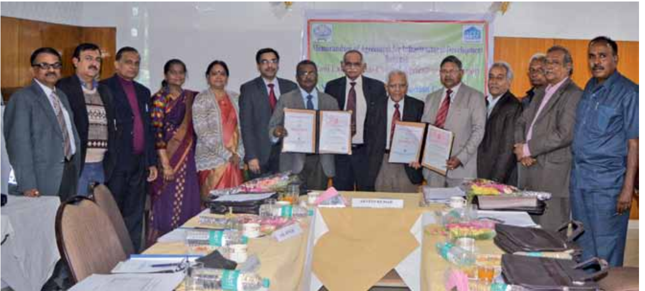
प्रबंध मंडल की दूसरी बैठक के दौरान आरएलबीसीएयू और एनबीसीसी के बीच समझौता ज्ञापन का आदान-प्रदान

वित्त समिति और प्रबंध मंडल ने क्रमशः दिनांक 21.09.2015 व 10.02.2016 को आयोजित अपनी बैठकों में प्रशासनिक ब्लॉक, शैक्षणिक ब्लॉक, पुस्तकालय, संकाय सदस्यों के आवासों, अतिथि गृह, वैज्ञानिक आवास, अंतर्राष्ट्रीय अतिथि गृह, छात्रावासों,