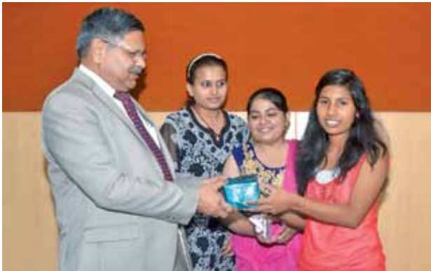
माननीय कुलपति छात्रों को पुरस्कार देते हुए

रानी लक्ष्मी बाई केन्द्रीय कृषि विश्वविद्यालय अधिनियम, 2014 की अनुसूची की धारा 29 और विधान (40) के प्रावधानों के अनुसार विश्वविद्यालय के पूर्व स्नातक अध्ययनों की शैक्षणिक गतिविधियों को विनियमित करने के लिए प्रबंध मंडल के अनुमोदन के पश्चात् पूर्व स्नातक अध्ययनों हेतु 'रानी लक्ष्मी बाई केन्द्रीय कृषि विश्वविद्यालय शैक्षणिक