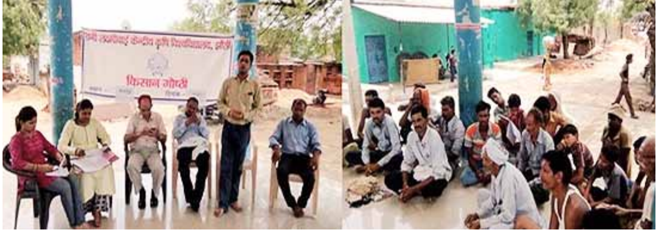
विश्वविद्यालय के संकाय सदस्य किसानों से चर्चा करते हुए

विश्वविद्यालय द्वारा 22 जून 2016 को अकबरपुर इटौरा गांव, जिला जालौन में बुंदेलखंड क्षेत्र में दलहनों और तिलहनों का उत्पादन बढ़ाने के लिए एक दिवसीय कार्यशाला का आयोजन किया गया। इस कार्यशाला में मुख्य अतिथि के रूप में विश्वविद्यालय