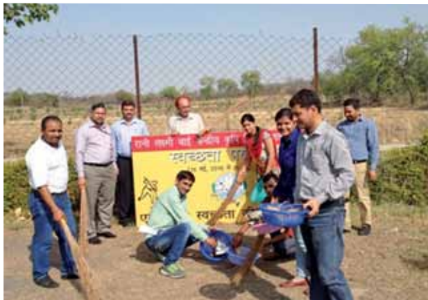
सफाई की ओर

स्वच्छ भारत अभियान से प्रेरणा लेते हुए रानी