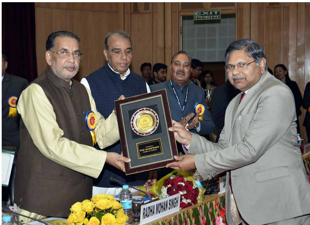
Sri Radha Mohan Singh, Hon'ble Minister of Agriculture and Farmers' Welfare presenting the award

innovations like Agriculture Education Day, e-Courses, National Talent Scholarship for P.G. students and new UG courses for much needed reforms to generate quality human resources for science led revolution in agriculture.