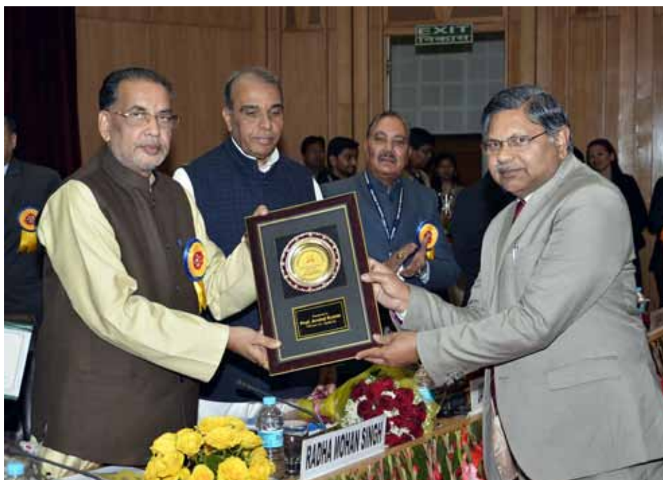
श्री राधा मोहन सिंह, माननीय केन्द्रीय कृषि एवं किसान कल्याण मंत्री पुरस्कार प्रदान करते हुए

के वैज्ञानिकों, स्टाफ सदस्यों तथा छात्रों ने रानी लक्ष्मी बाई केन्द्रीय कृषि विश्वविद्यालय, झांसी में 21 जून 2016 को आयोजित योग दिवस में सक्रिय रूप से भाग लिया तथा योग को अपने दैनिक जीवन का अभिन्न अंग बनाने की शपथ ली। एकत्रित लोगों ने विभिन्न आसन, प्राणायाम और तनाव मुक्ति संबंधी व्यायाम किए। तनाव से बचने और उसका प्रबंध करने में योग के विभिन्न पहलुओं पर चर्चा की गई ताकि स्वस्थ जीवन जिया जा सके। दो घंटे के इस कार्यक्रम का समापन हंसी योग तथा विश्व शांति और सौहार्द की प्रार्थना के साथ हुआ।