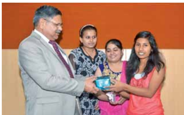
Distribution of Prizes to the Students by Hon'ble Vice Chancellor

graduate degree classes in Agriculture with the support of Scientific staff and Research Laboratories of ICAR Research Institutes/Govt. Departments located at Jhansi and nearby areas.